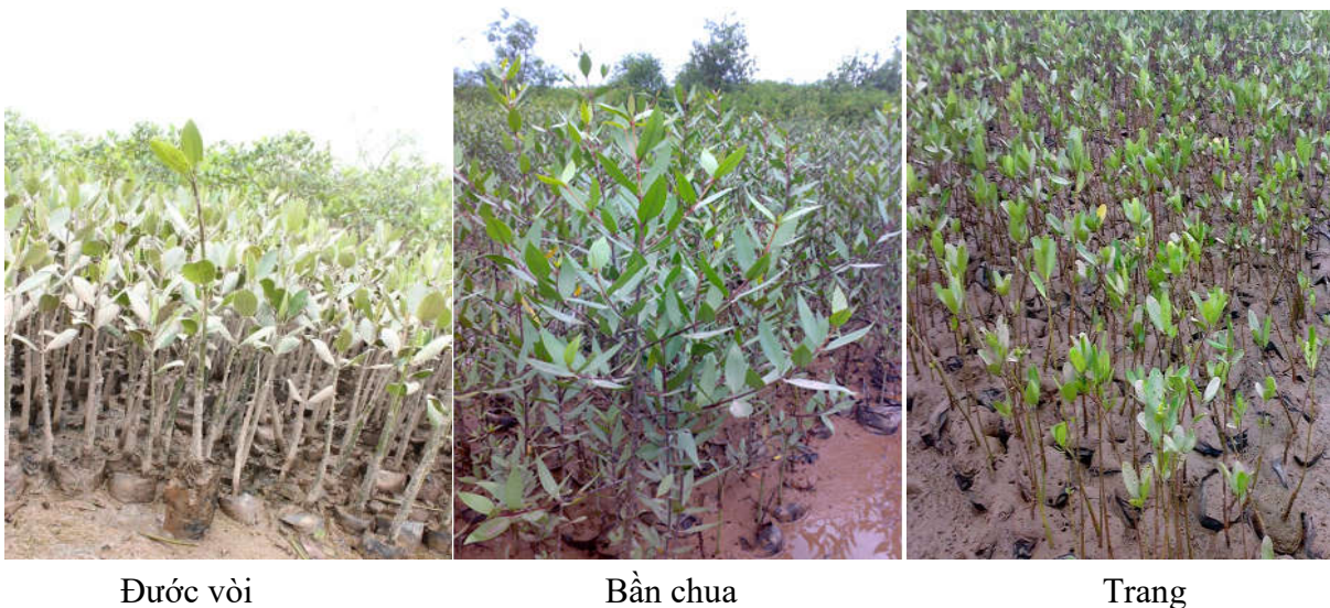
Hình 04. Một số hình ảnh thí nghiệm tạo cây con 3 loài cây Đước vôi, Bần chua và Trang

Kết quả nghiên cứu được tổng hợp ở bảng 04 cũng cho thấy: cùng với biến động về tỷ lệ sống của từng loài khi được trồng ở các độ mặn khác nhau là biến động về chiều cao của cây. Đối với loài Trang, sinh trưởng chiều cao tốt nhất ở độ mặn 15‰, chiều cao trung bình của cây đạt 52,7(cm); chiều cao cây tốt nhất đối với Bần chua là 71,7(cm) ở độ mặn 10‰ và Đước vôi là 53,5(cm) khi ở độ mặn 30‰.