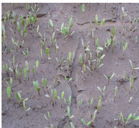
Hình 01. Bần chua sau gieo vơm 18 ngày