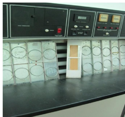
Hình 1. Thiết bị thử nghiệm thời tiết gia tốc Ultra-violet/condensation weathering device